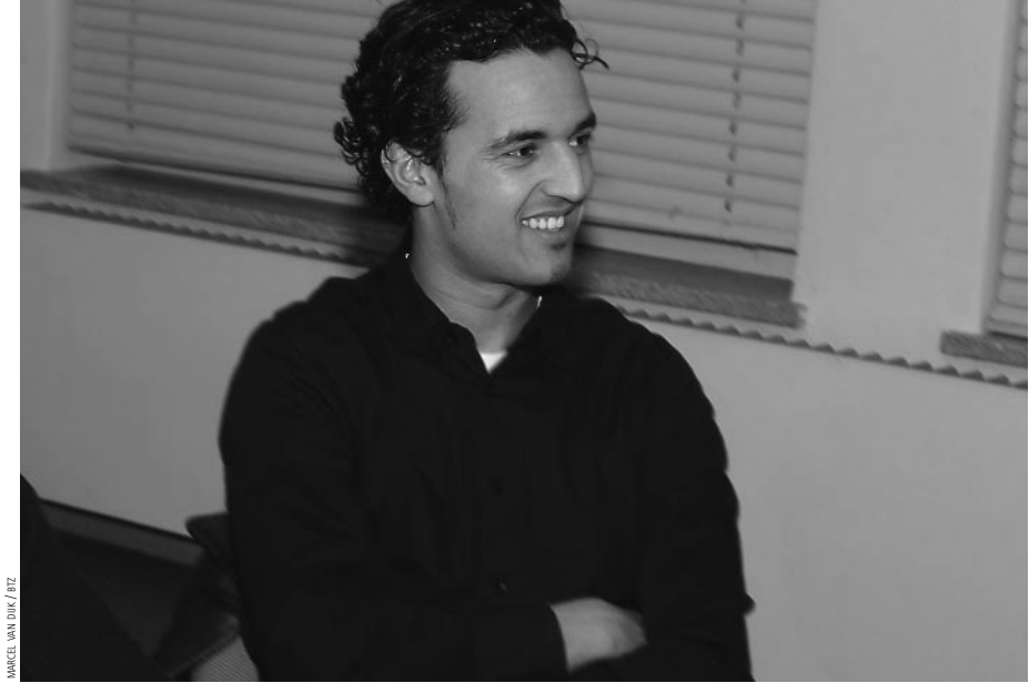
MARCEL VAN DER BEEK / BIZ