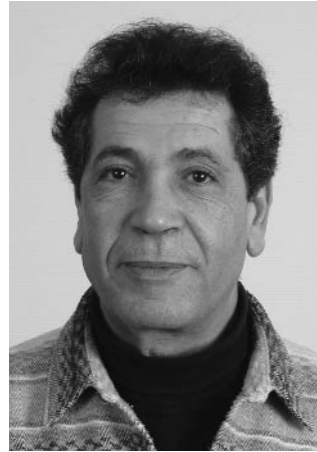
MAROKKANEN / SMJH