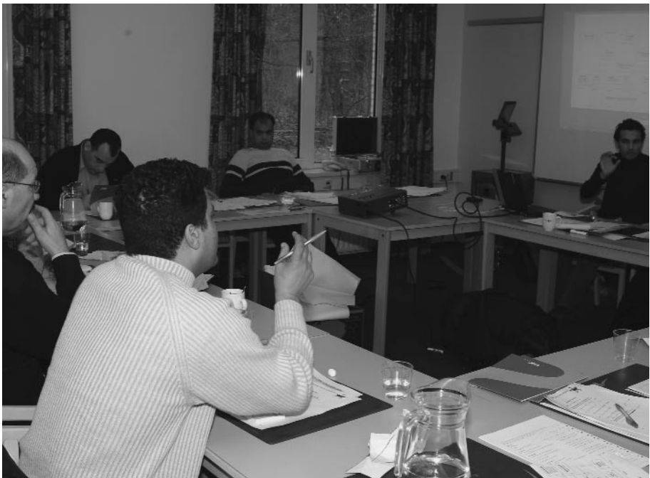
Bijeenkomst over veranderingen in de organisatie.

De jongeren van de SMJH kunnen een stootje hebben. Negatieve berichtgeving of niet, zij gaan op de ingeslagen weg verder. Maar bij andere Marokkaanse jongeren kan dit makkelijk tot apathie leiden. Een houding van wij tegen zij en een gevoel er niet bij te horen. Ik denk dat media en politici vaak niet in de gaten hebben wat ze aanrichten. Tot voor enkele jaren hadden jongens het over uitgaan en meisjes, nu hoor ik ze steeds